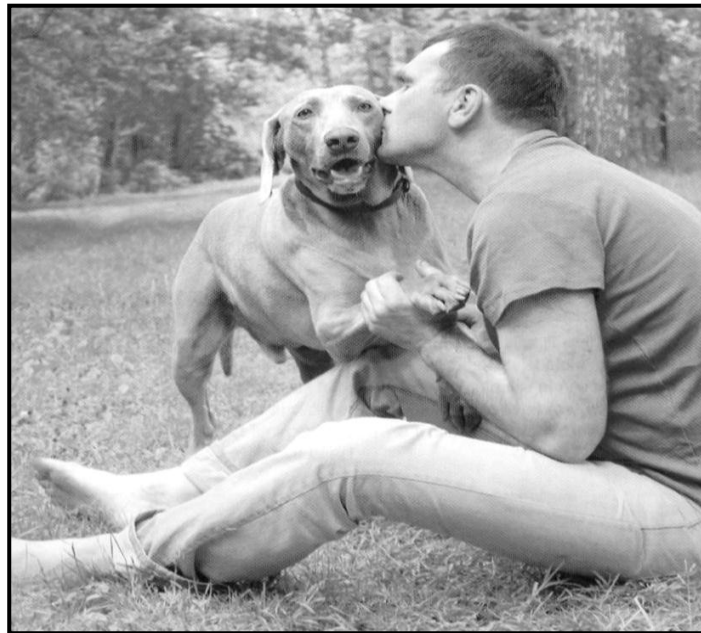
[Mothopo: Skyways , June 2015]