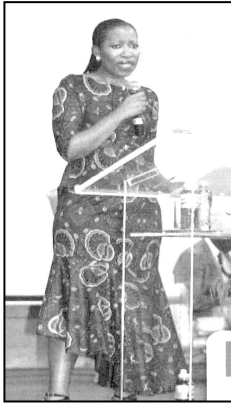
[Mothopo: Move , March 2014]