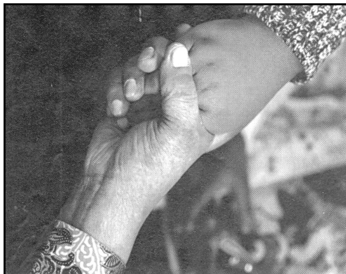
[Mothopo: Skyways , June 2015]