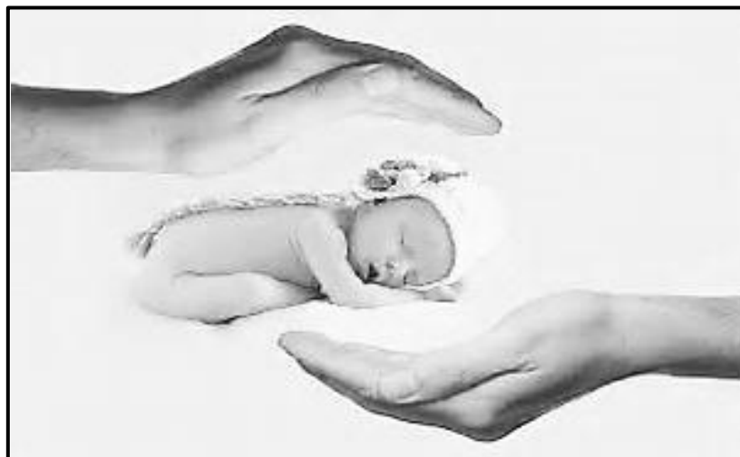
[Setshwantsho se qotsitse inthaneteng]