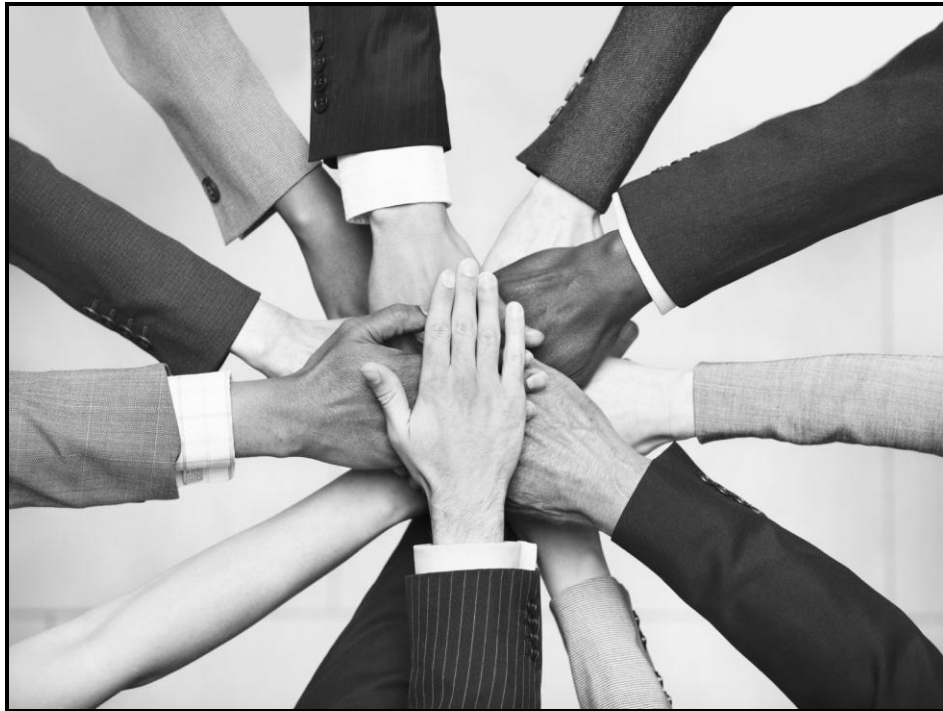
[Zwi bva kha: www.google.images ]