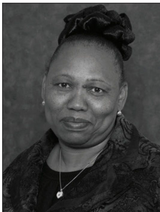
Matsie Angelina Motshekga, MP Minister of Basic Education

MRS AM MOTSHEKGA, MP MINISTER DATE: 14 NOVEMBER 2019