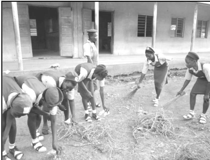
[E nopotswe go tswa mo inthaneteng]