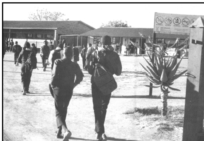
[Se nopotswe go tswa mo, The New Age , 20 Tlhakole 2018]

Tshireletsego mo dikolong ke tlhobaboroko. Kwalela Tonakgolo ya Lefapha la Tshireletso lekwalo o mo kope go dira lenaneo la dikgakololo tsa tshireletso ya barutwana le barutabana mo dikolong.