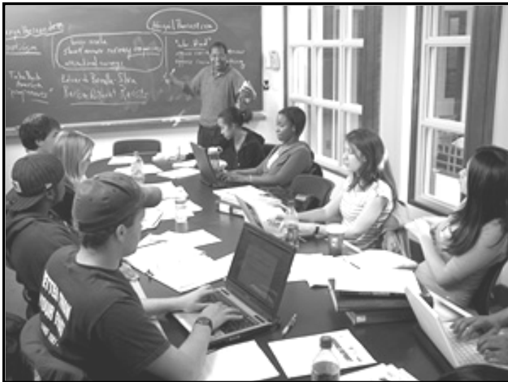
[Se nopotswe go tswa mo inthaneteng]

O tsenetse dithuto tsa malatsi a boikhutso kgatllhanong le maikutlo a ga mogoloo yo o neng a bona e le tshenyoye ya nako. Batsadi ba gago ba ne ba dumelana le wena, mme ba go ema nokeng. Ba kwalele lekwalo o ba lebogetse le go ba bolelela ka fa di go thusitseng ka gona go ipaakanyetsa ditlhatlhobo tsa makgaolagang.