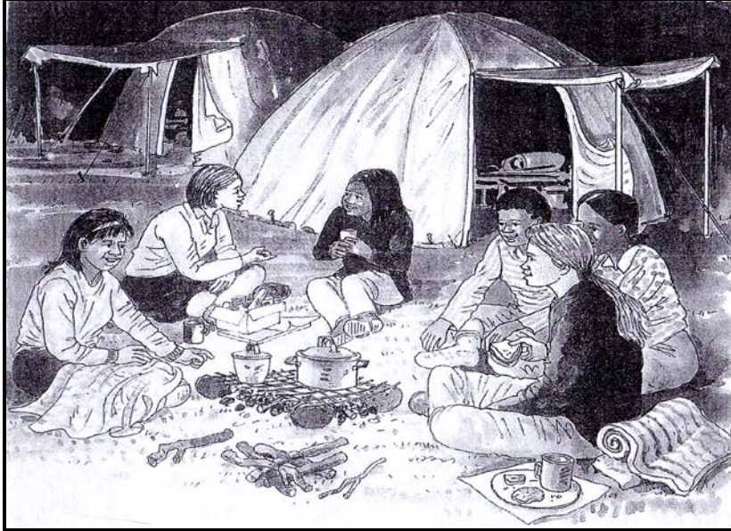
[Zwi khou bva kha Magazine]