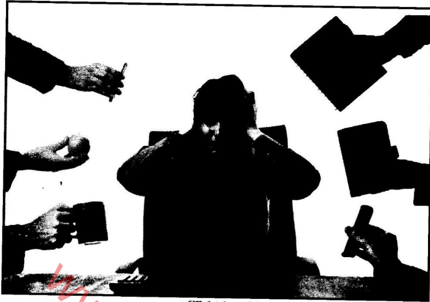
[Tshi bva kha http://www.google.images ]