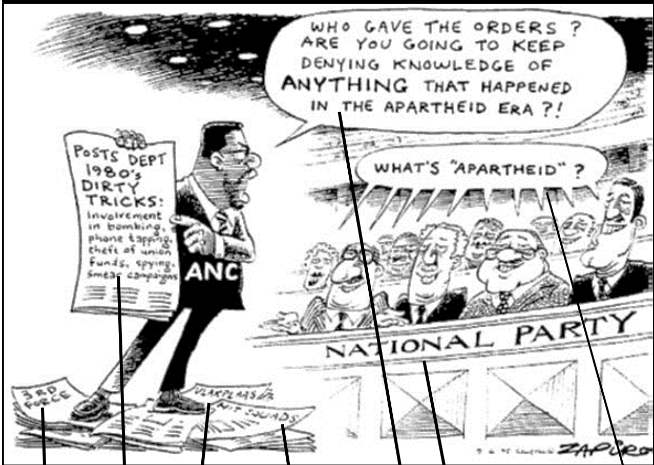
[Uit Sowetan, 9 Junie 1995]

*Zapiro – 'n Welbekende Suid-Afrikaanse spotprentjie-tekenaar