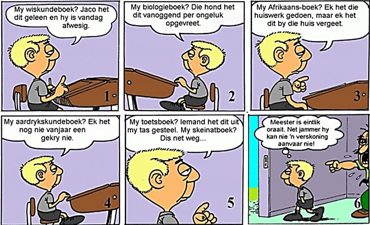
[Aangepas: https://cutt.ly/llxY1vq ]

4.1 Skryf die volgende sin in die INDIREKTE REDE .