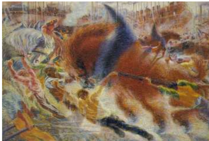
FIGUUR 3b: Umberto Boccioni, The city rises , 1910, olie op doek.