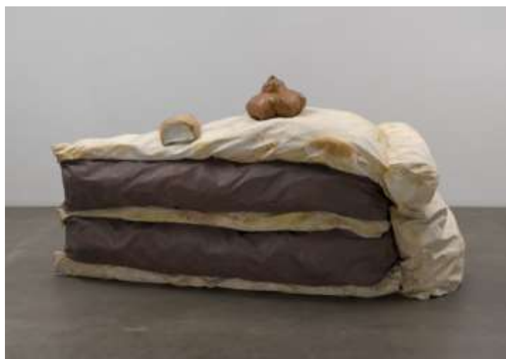
FIGUUR 6c: Claes Oldenburg, Floor cake , 1962, sintetiese polimeerverf en lateks.