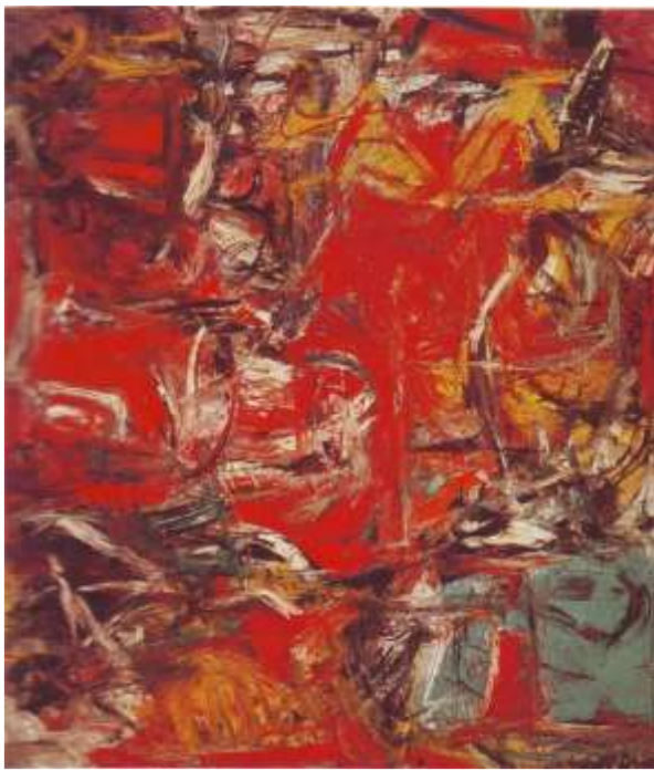
FIGUUR 8a: Willem de Kooning. Woman IV .