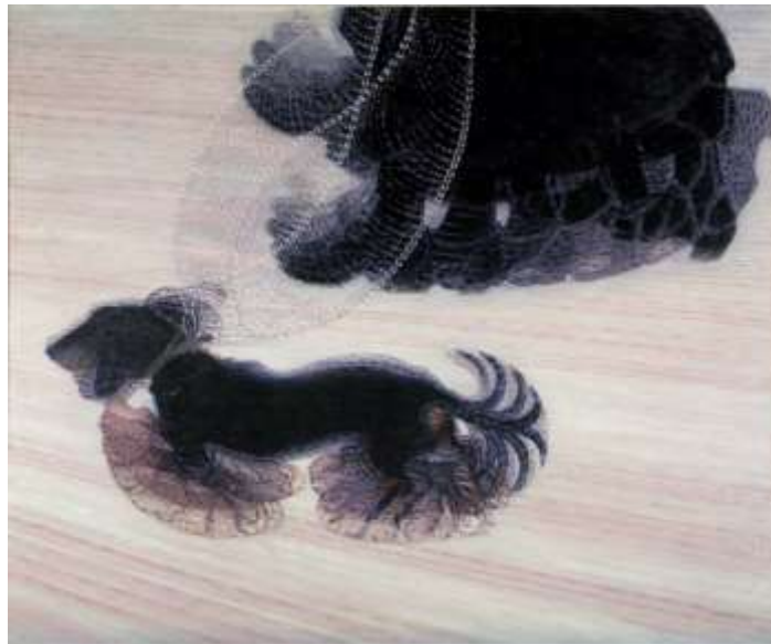
FIGUUR 3a: Giacomo Balla, Dynamism of a dog on a leash , 1912.