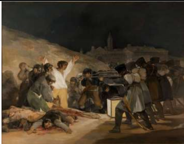
FIGUUR 1a: Francisco de Gouya, The third of May , 1808.