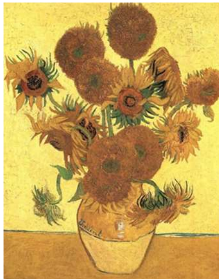
FIGUUR 2b: Van Gogh, Sunflowers , 1888, olie op doek.