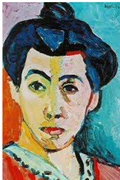
FIGUUR 3c: Henri Matisse, The green stripe , 1905, olie op doek.