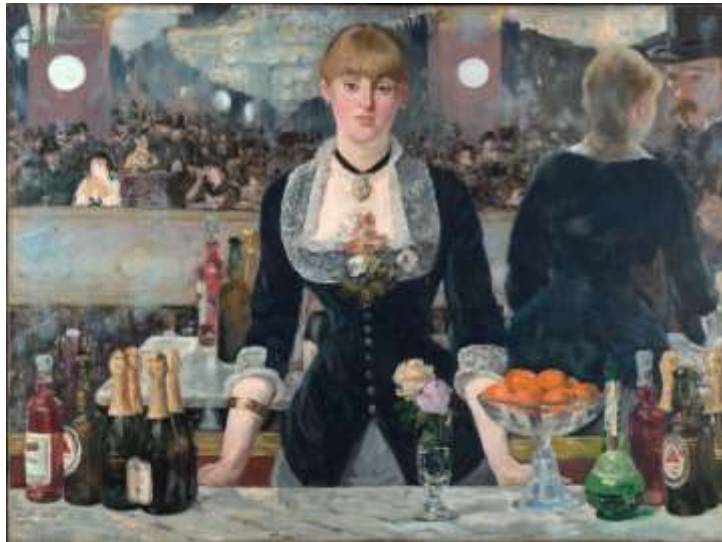
FIGUUR 2a: Edouard Manet, A Bar at Folies-Bergere , 1882, olie op doek.