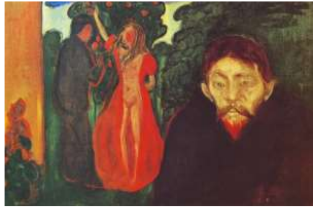
FIGUUR 8b: Edvard Munch. Dance of Life . 1884.