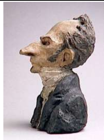
FIGUUR 1c: Honore Duamier, Jacques-Levere , 1856.