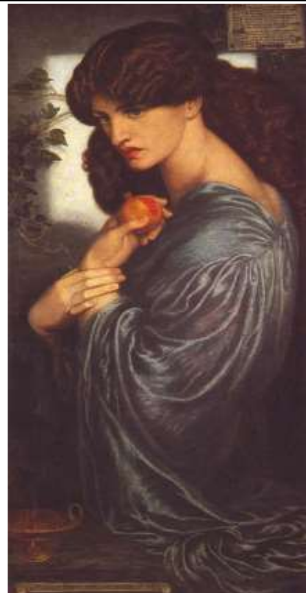
FIGUUR 8d: Dante G. Rossetti. Proserpine . 1874.