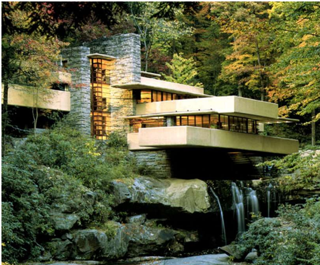
FIGUUR 4a: Frank Lloyd Wright " Falling water ", Kaufmann-huis, Bear Run, Pennsylvania, 1936.