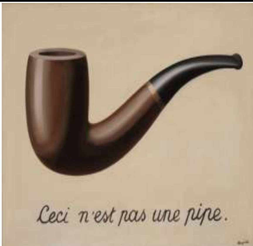
FIGUUR 5b: Rene Magritte, This is not a pipe , 1931, olie op doek.