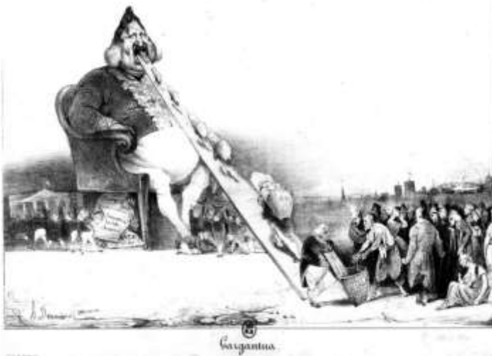
FIGUUR 1b: Honore Duamier, Gargantua .