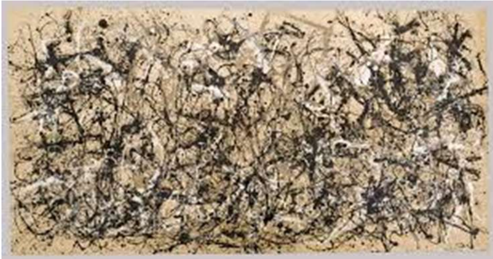
FIGUUR 6a: Jackson Pollock, Autumn Rhythm (number 30) , olie op doek.