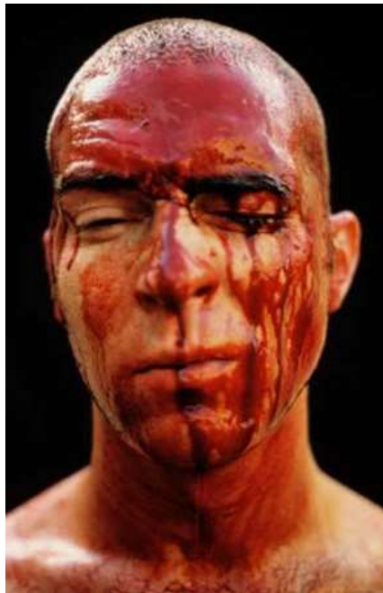
FIGUUR 7b: Kendall Geers, Bloody Hell , 1990.

Die gevriesde beeld is geskep met 4,5 liters van die kunstenaar se eie bloed wat oor 'n tydperk van vyf maande getrek is.