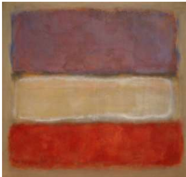
FIGUUR 6b: Mark Rothko, Ongetiteld (Pers, wit en rooi) , 1953, olie op doek.