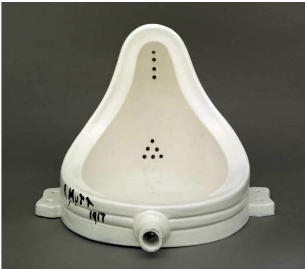
FIGUUR 5a: Marcel Duchamp, Fountain , 1917.