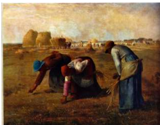
FIGUUR 1d: Jean-Francois Millet, The Gleaners , 1857, olie op doek.