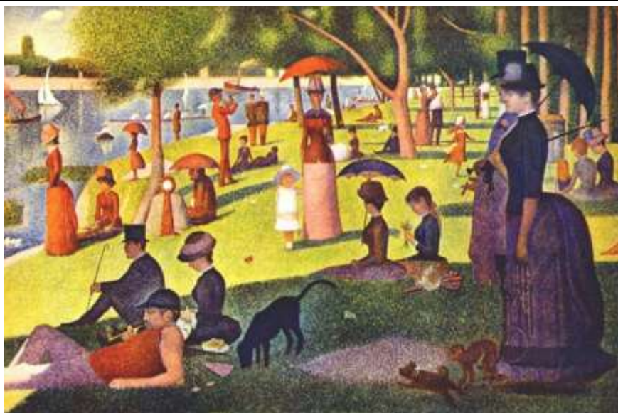
FIGUUR 2c: George Seurat, La Grand Jatte ( Sunday afternoon on the Island of La Grand Jatte ), 1884-1886, olie op doek.