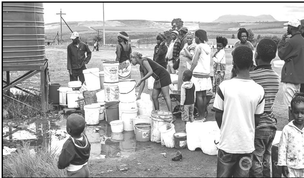
[Xifaniso lexi xi huma eka webusayiti ya www.E360.yale.edu.com ]