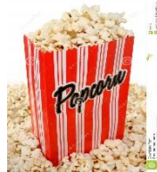
Vraag en aanbod van springmielies