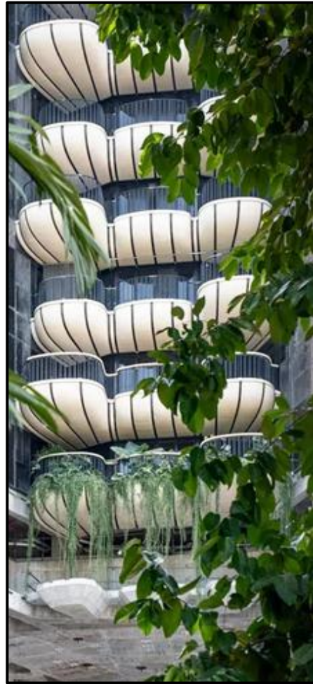
FIGUUR K: Ultraluukse toringgebou-hotel in Singapoer met organiese, kroonblaarvormige balkonne deur Heatherwick Studio (Londen), 2021.