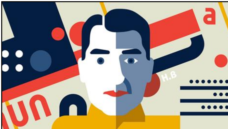
FIGUUR I: Bauhaus-styl-illustrasie deur Vesa Sammallahti vir Dezeen aanlyn tydskrif (Denemarke), 2018.

Skryf 'n opstel (ten minste EEN bladsy) waarin jy die illustrasies in FIGUUR H en FIGUUR I hierbo vergelyk. Verduidelik hoekom hulle tipies is van die ontwerpbewegings wat hulle verteenwoordig.