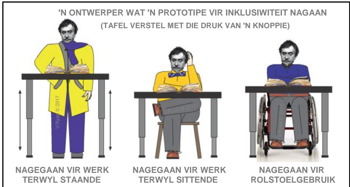
FIGUUR J: Inklusiewe Ontwerpprototipe deur V Ryan (VSA), 2017.