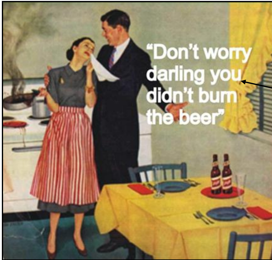
FIGUUR C: Schlitz-bieradvertensie , ontwerper onbekend (Amerika), 1950's.

Bespreek die gebruik van geslagstereotipering en vooroordeel in die plakkaat in FIGUUR C hierbo.