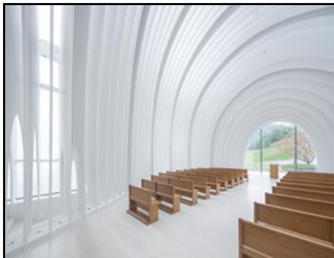
FIGUUR G: Chamber Church deur Büro Ziyu Zhuang (China), 2022.