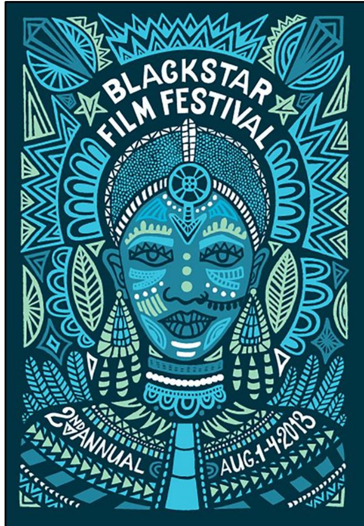
FIGUUR A: Black Star-filmfeesplakkaat ontwerp deur Andrea Pippins (VSA), 2016.

1.1.1 Analiseer die gebruik van die volgende elemente en beginsels in FIGUUR A hierbo: