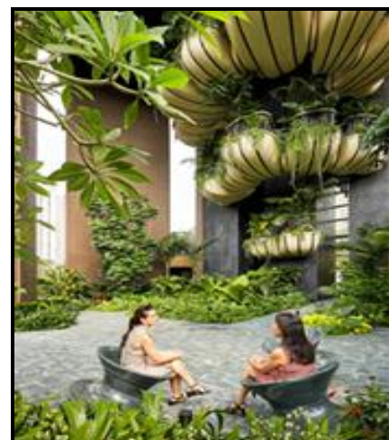
Binne- en buiteansigte

Die interieur en eksterieur van die gebou se ontwerp in FIGUUR K werk na 'n 'groener visie' vir die toekoms wat tot voordeel van die mensdom is.