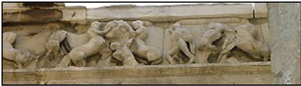
FIGUUR F: Tempel van Hephaestus deur Ictinus (Griekeland), 450 VHJ.