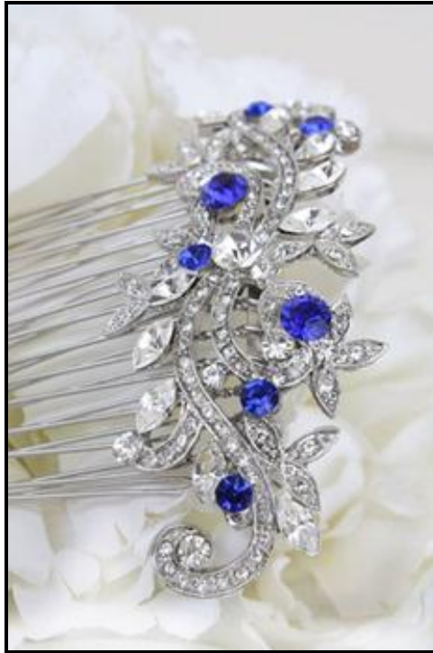
FIGUUR D: Saffier-bloukristal-bruidshaarkam deur Swarovski (Oekraïne), 2009.