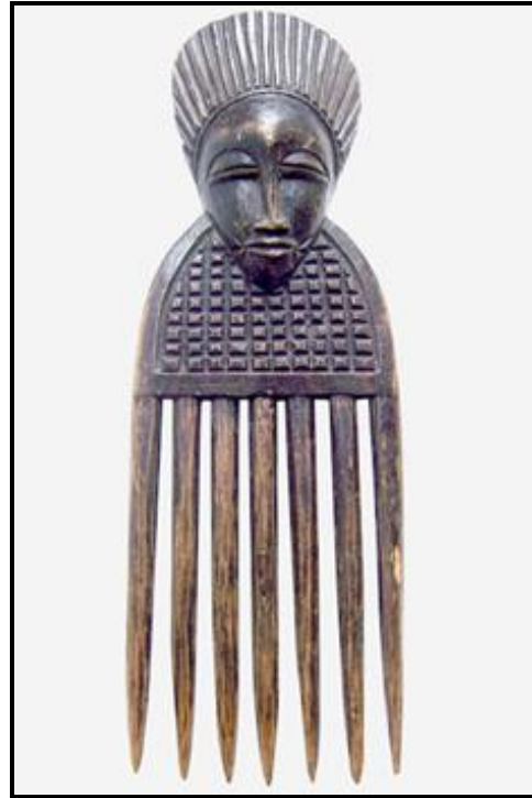
FIGUUR E: Die Afrika-houtkam , ontwerper onbekend (Kongo), ongedateer.

Skryf 'n paragraaf deur die haarkamme in FIGUUR D en FIGUUR E te vergelyk met verwysing na die volgende: