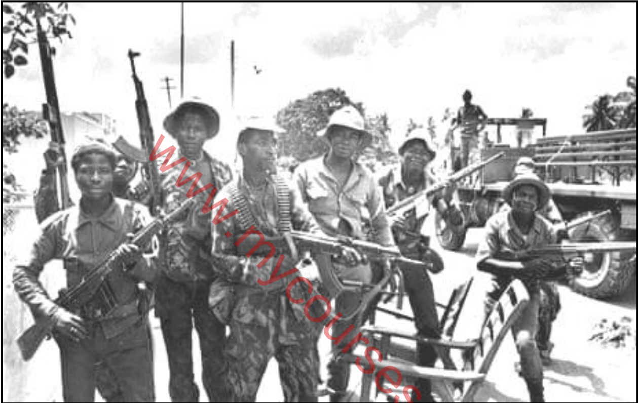
[Uit die Guardian -koerant, 5 Mei 2014]

Die foto hieronder met die titel 'Angola's Brutal History and the MPLA's Role in it', het in die Guardian -koerant van 5 Mei 2014 verskyn. Dit is in Desember 1975 geneem en beeld soldate van die 'Popular Movement for the Liberation of Angola' (MPLA) uit wat in die Angolese Burgeroorlog geveg het.