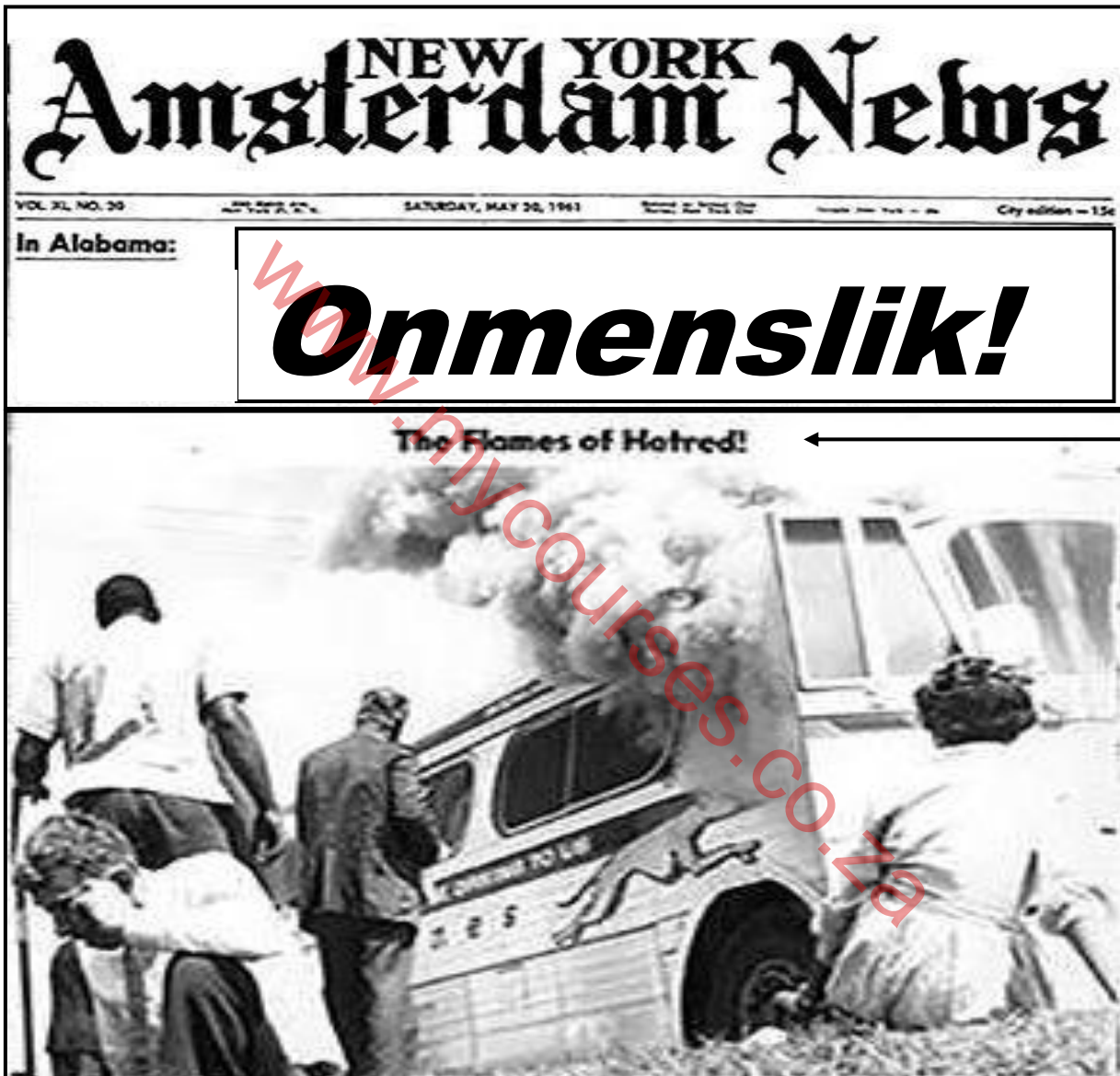
[Uit NEW YORK Amsterdam News , 20 Mei 1961]

Die koerantberig hieronder is op 20 Mei 1961 in die NEW YORK Amsterdam News gepubliseer. Dit het 'n foto gebruik om doeltreffend verslag te doen oor die uitdagings wat Vryheidsryers met hulle betoging teen rassese segregasie in die Verenigde State van Amerika teëgekrom het.